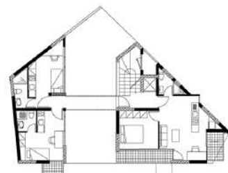
ΚΑΤΩΦΗ Α' ΟΡΟΦΟΥ