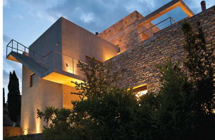
Σύνθεση επιπέδων μέσω διακριτής σκάλας.