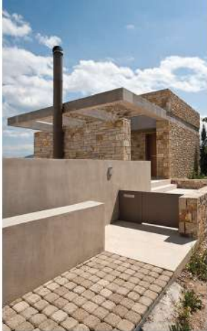
Ο χώρος εισόδου.