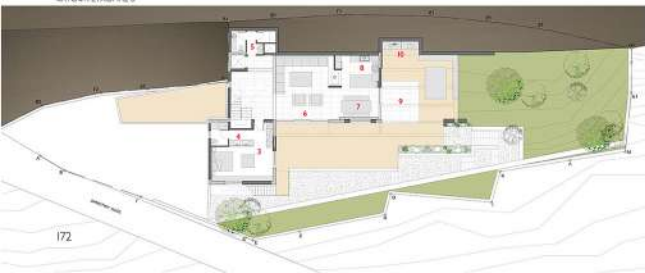
ΚΑΤΩΦΗ ΣΤΑΘΜΗ Θ