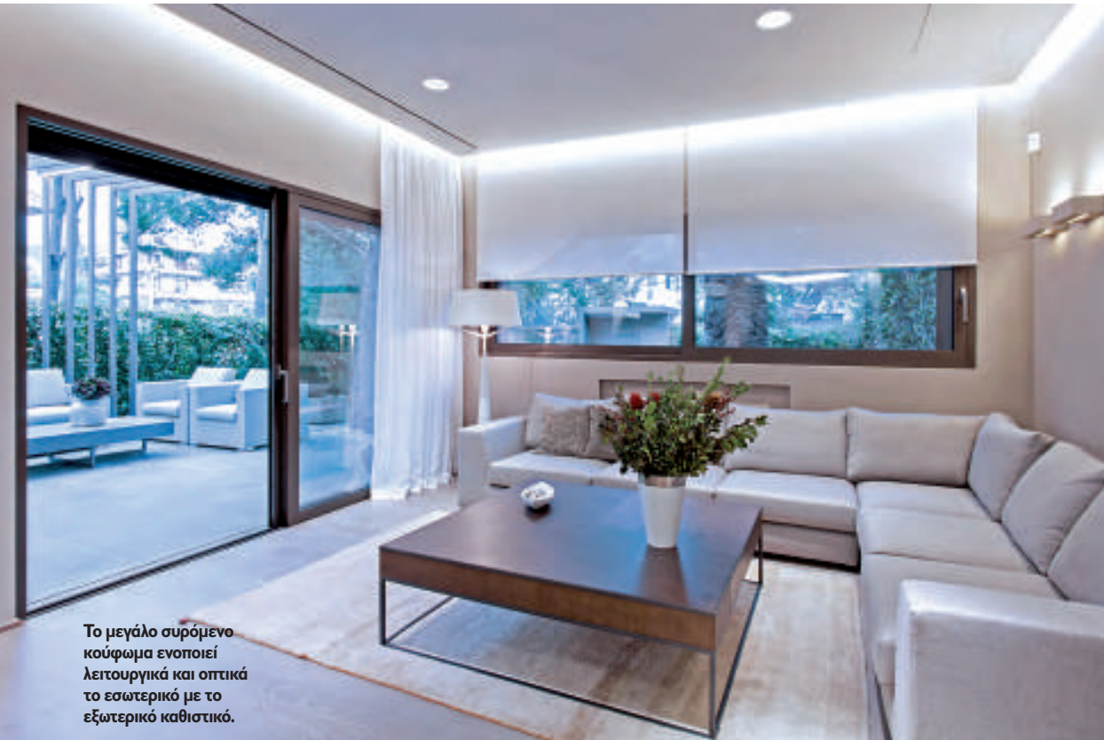
Το μεγάλο συρόμενο κούφωμα ενοποιεί λειτουργικά και οπτικά το εσωτερικό με το εξωτερικό καθιστικό.