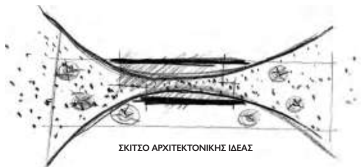
ΣΚΙΤΣΟ ΑΡΧΙΤΕΚΤΟΝΙΚΗΣ ΙΔΕΑΣ

Στη μέση επιμήκουσ οικοπέδου, αναλογίας 1:4, τοποθετήθηκε πριν από 30 χρόνια αυτή η τυπική δώροφη μονοκατοικία. Εγκλωβισμένη μεταξύ ενός όμορου κτιρίου (τυφλή νότια όψη) και μιας πολυκατοικίας, διατηρούσε μια σχεδόν ανύπαρκτη επαφή με τον εξωτερικό χώρο αποκλειστικά σε δύο στενές όψεις. Η βορινή της πλευρά με μικρά βοηθητικά ανοίγματα, απευθυνόταν στην υπαίθρια πορεία, που συνδέει τον ανατολικό με το δυτικό περιβάλλοντα χώρο.