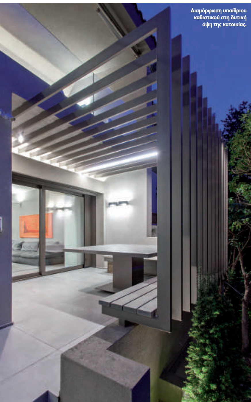
Διαμόρφωση υπαίθριου καθιστικού στη δυτική όψη της κατοικίας.